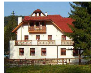
Penzion u Ráztoky

www.hotelrusava.cz ; www.rzrusava.cz ; www.kolibacecher.webzdarma.cz ; www.ubytovani-raztoka.cz